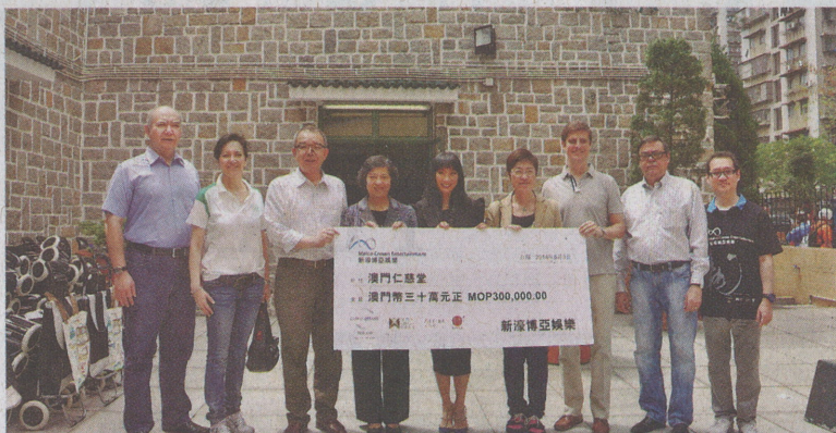
新濠博亞娛樂代表昨向社服店送交三十萬元善款支票